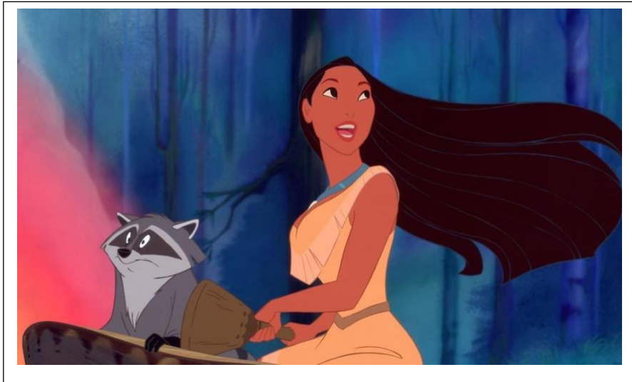
Les églantines → Pocahontas