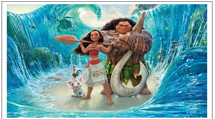
Les coquelicots → Vaianas